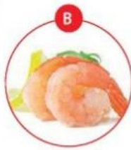
B KREBSTIERE- UND DARAUS GEWONNENE ERZEUGNISSE