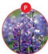
P LUPINEN UND DARAUS GEWONNENE ERZEUGNISSE