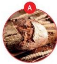
A GLUTENHALTIGES GETREIDE UND DARAUS GEWONNENE ERZEUGNISSE