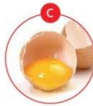
C EIERVON GEFLÜGEL UND DARAUS GEWONNENE ERZEUGNISSE