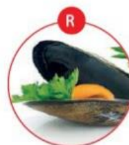
R WEICHTIERE WIE SCHNECKEN, MUSCHELN, TINTENFISCHE UND DARAUS GEWONNENE ERZEUGNISSE