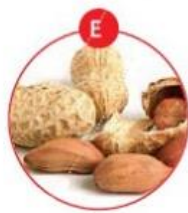
E ERDNÜSSE UND DARAUS GEWONNENE ERZEUGNISSE