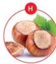
H SCHALENFRÜCHTE UNDDARAUS GEWONNENE ERZEUGNISSE