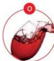
O SCHWEFELDIOXID UND SULFITE