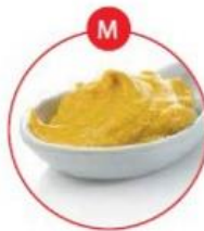
M SENF UND DARAUS GEWONNENE ERZEUGNISSE