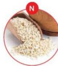
N SESAMSAMEN UND DARAUS GEWONNENE ERZEUGNISSE