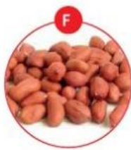
F SOJABOHNEN UND DARAUS GEWONNENE ERZEUGNISSE