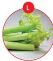
L SELLERIE UND DARAUS GEWONNENE ERZEUGNISSE