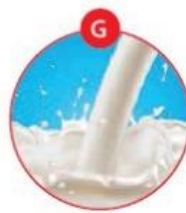
G MILCH VON SÄUGETIEREN UND MILCHERZEUGNISSE (INKLUSIVE LAKTOSE)